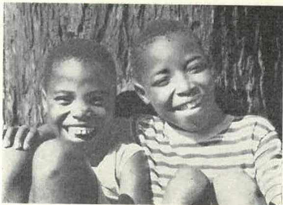
Estes dois rapazes representam milhares de jovens africanos em necessidade dos benefícios de uma educação

o nosso trabalho, pois é nelas que os professores, ministros e todos os demais obreiros para estes países, recebem a sua educação. Infelizmente, porém, devido à falta de fundos e de facilidades não é possível realizar um curso ministerial, todos os anos, no Colégio de Gítwe. Actualmente, há