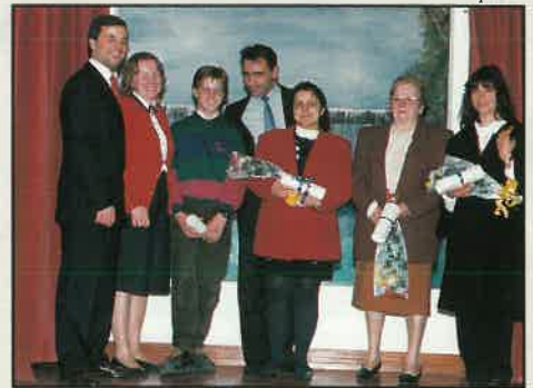
Membros baptizados no Barreiro acompanhados do casal Pastoral

Com esta acção de evangelismo infantil, Deus trouxe