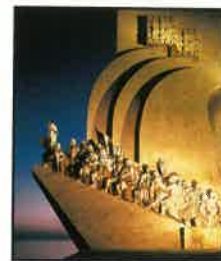
12 A Igreja em Portugal