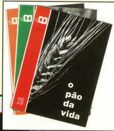
Curso "A Bíblia Fala"