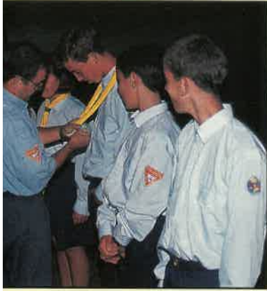
to de Desbravadores - Costa de Lavos

Estas iniciativas que acabamos de referir