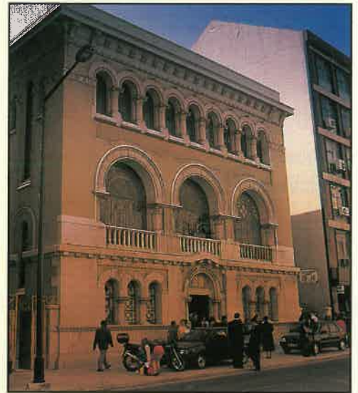
Fachada da Igreja Central de Lisboa

D igno de registo é o artigo de Aprígio Mafra escrito a 20 de Fevereiro de 1930 no vespertino Diário de Lisboa acerca da Igreja Adventista: - "Na Rua Joaquim Bonifácio, para os lados da Estefânia, há uma igreja que, vista por fora, lembra um teatro ou um museu. Muito limpa, muito gentil, muito airosa, é lá que têm a sua sede os Adventistas de Lisboa e os seus irmãos em