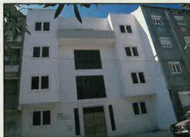
Igreja do Barreiro