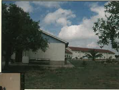
Imagens do Lar Adventista para Idosos - LAPI

Queimado - Salvaterra de Magos, que, na sua primeira fase, funcionou com capacidade para 40 utentes. Em Março de 1991, a sua capacidade foi aumentada para 76 utentes e, ali, presente-