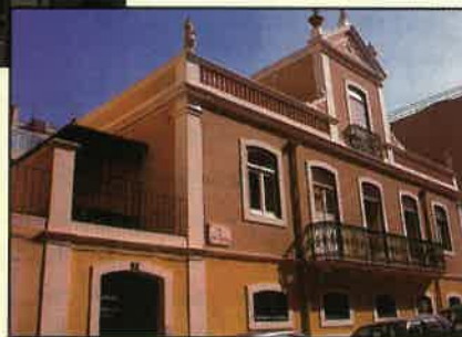
Fachada do Colégio Adventista de Lisboa

Ainda existem, em fase de construção, dois lares similares para melhor resposta às necessidades: