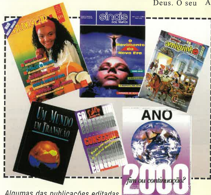
Algumas das publicações editadas pela Publicadora Atlântico.

A sociedade é construída sobre o casamento e a família. O casamento foi instituído por Deus no Éden e confirmado por Jesus como uma união vitalícia. Deus abençoa a família e tenciona que os seus membros se