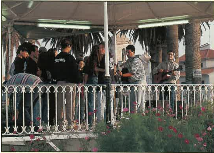
Acampamento Missionário – Peniche

Verão, a Igreja organiza um Acampamento de Famílias onde, durante alguns dias, se debatem alguns problemas que, nos dias de hoje, enfraquecem a unidade familiar.