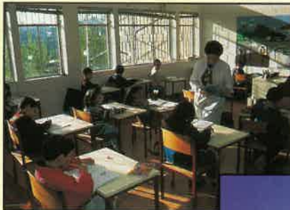
Colégio Adventista de Oliveira do Douro

Queimado - Salvaterra de Magos, que, na sua primeira fase, funcionou com capacidade para 40 utentes. Em Março de 1991, a sua capacidade foi aumentada para 76 utentes e, ali, presente-