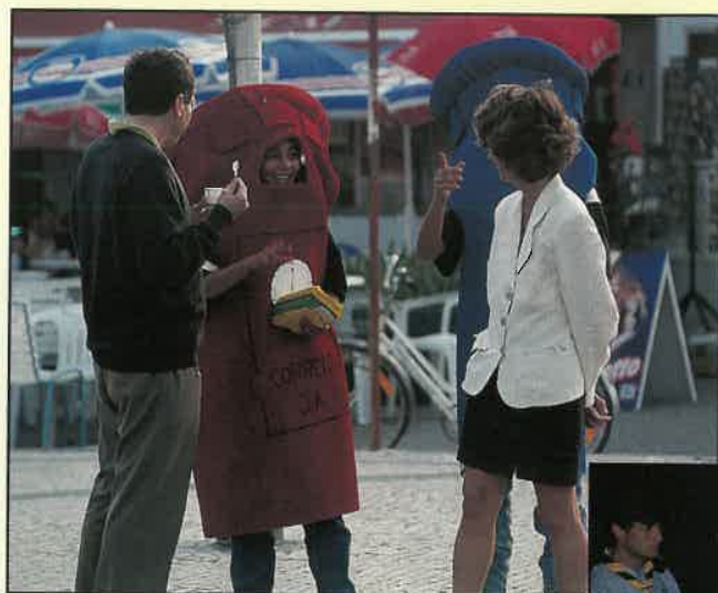
Acampamento Missionário - Peniche

Todos estes grupos têm objectivos comuns - a descoberta e o cuidado da natureza, o serviço em favor da comunidade e do mais desfavorecido, um estilo de vida, física e espiritual agradável a Deus. O seu