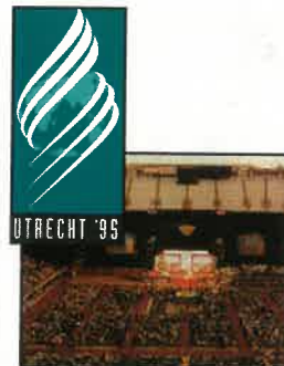
10 Conferência Geral – Como Tudo Começou

Numa época em que a ciência é detentora de “quase” toda a verdade e caminhamos para uma outra vertente – a espacial, o que a Palavra de Deus nos diz sobre este assunto?